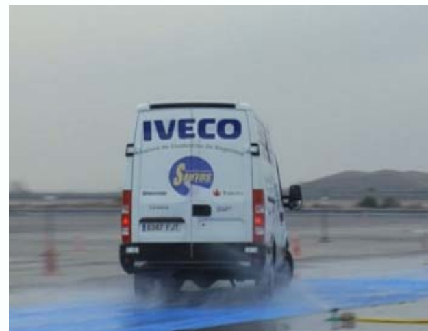
Jornadas de Seguridad en la conducción de la Dirección General de Transportes (Ministerio de Fomento)