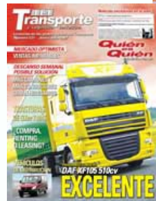
Transporte y Logística terrestre