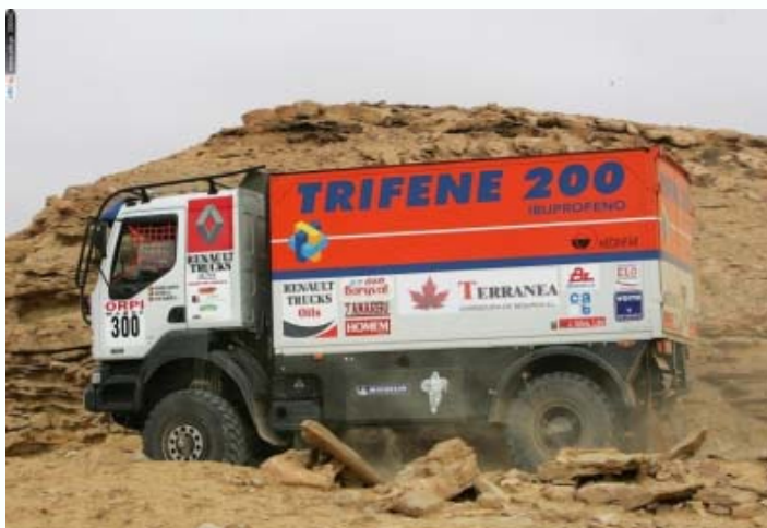
Paris – Dakar (Renault Kerax)