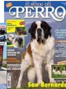
El mundo Del perro